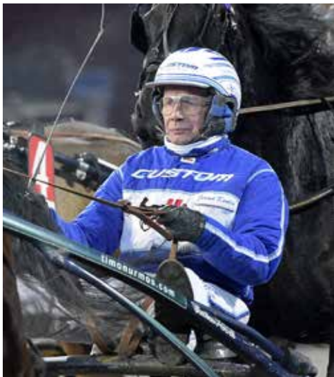
Jorma Kontio (bilden) är en av världens bästa kuskar genom tiderna. Denna lunch gästas han Axevalla.