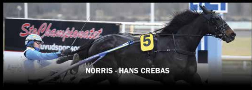
NORRIS - HANS CREBAS

Hemmasegrar från 20 januari